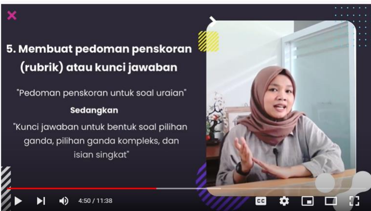
Video Pembelajaran 3