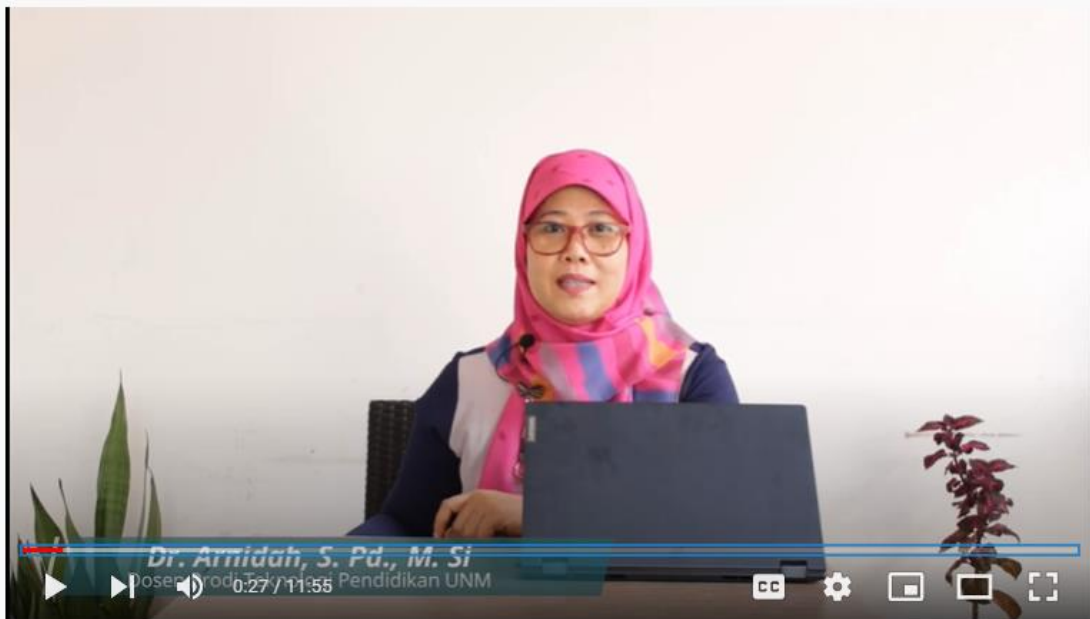
Video Pembelajaran 1