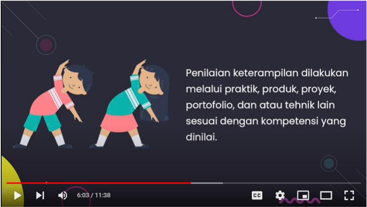
Video Pembelajaran 3