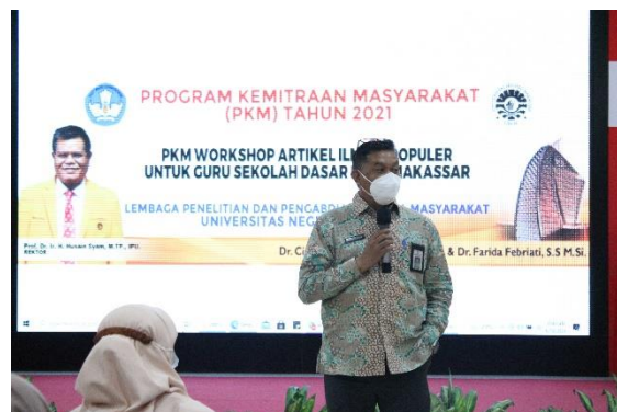
Gambar 5. Pembukaan oleh Kabid GTK Dinas Pendidikan Kota Makassar