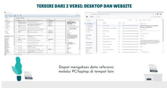
Gambar 11. Versi Mendeley

Mendeley merupakan software manajemen referensi dan jaringan sosial akademis yang bisa membantu Anda mengorganisir penelitian, berkolaborasi dengan peneliti lain secara online dan menemukan publikasi penelitian terakhir. Menurut (Kusmayadi 2014 : 3) aplikasi Mendeley merupakan aplikasi untuk membuat sitasi dan reference manager yang banyak digunakan oleh peneliti dan akademisi, khususnya bagi mahasiswa yang sedang menulis tesis dan disertasi dalam mensitasikan (menyitir) sumber-sumber referensi, terutama dari jurnal. Mendeley merupakan salah satu perangkat lunak manajemen referensi berbasis open source yang dapat diperoleh secara gratis dan mendukung berbagai platform seperti Microsoft Windows , Apple MacOS , maupun Linux . Mendeley merupakan kombinasi dari aplikasi desktop dan situs web yang dapat digunakan untuk mengelola, berbagi, dan mencari referensi maupun kontak.