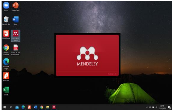
Gambar 10. Aplikasi Mendeley

pengenalan aplikasi Mendeley dan cara menggunakannya.