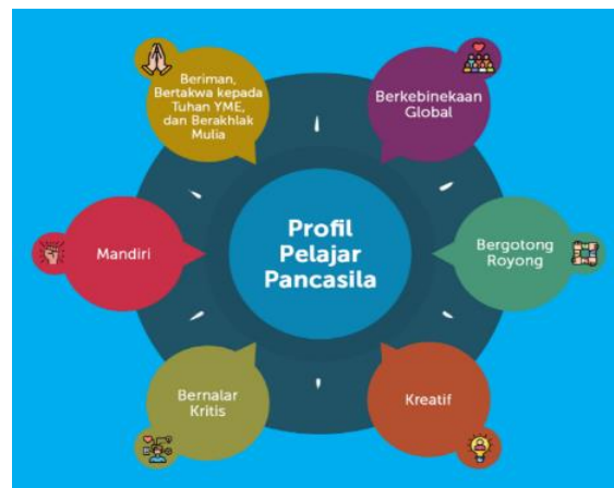
Gambar 1. Profil Pelajar Pancasila

Profil pelajar Pancasila memiliki enam ciri utama: beriman, bertakwa kepada Tuhan YME, dan berakhlak mulia, berkebinekaan global, bergotong royong, mandiri, bernalar kritis, dan kreatif, seperti dikutip dari laman Kementerian Pendidikan, Kebudayaan, Riset dan Teknologi. ( https://www.detik.com/edu/sekolah/d-5635708/6-profil-pelajar-pancasila-yang-dirumuskan-kemendikbud-ini-lengkapnya ).